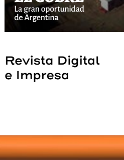
Revista Digital e Impresa EL COBRE