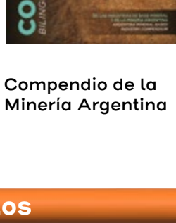
Compendio de la Minería Argentina