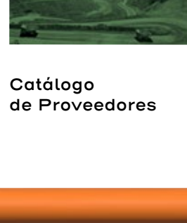
Catálogo de Proveedores